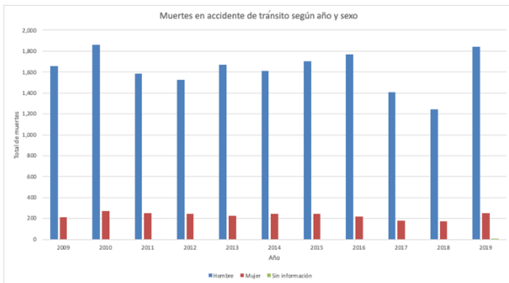
Gráfica 1. Total de muertes por accidentes de tránsito según año y sexo, período 2009-2019.

Entre el año 2009 hasta el año 2019, se registraron 20,392 muertes ocasionadas por accidentes de tránsito, con un promedio anual de 1,854. La tasa de mortalidad promedio para este período de tiempo es de 18.8 muertes por cada 100,000 habitantes. El sexo masculino fue el más afectado, con un 88% de las muertes (Gráfica 1). Por otro lado, los grupos de edades que presentaron mayor mortalidad fueron los de 15-19, 20-24 y 25-29 años con un promedio en los últimos 10 años de 9.48%, 14.36% y 10.54%.